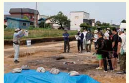
現地見学会の様子 (令和5年度調査 青森市郷山前村元遺跡)