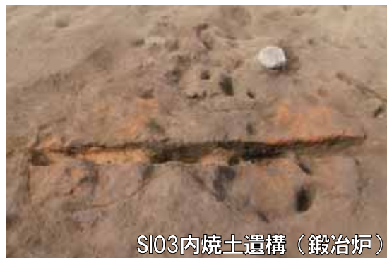
SI03内焼土遺構（鍛冶炉）

これらは鉄製品作りに関連した遺構・遺物と考えられ、鉄製品も複数点出土しています。