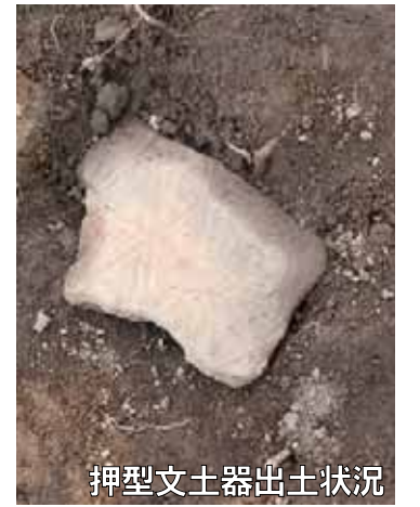
押型文土器出土状況