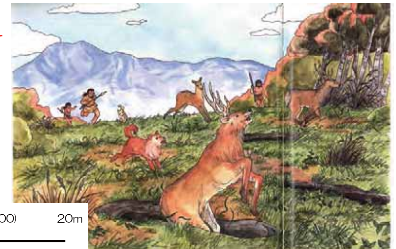
落し穴による少人数狩り。おもしろい通り道に落し穴をつくりました。伊豆 縄文時代早期前葉の遺物