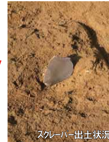
スクレーパー出土状況