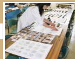
図版組み・原稿執筆