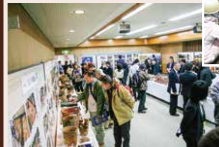
青森県埋蔵文化財発掘調査報告会(遺物展示)