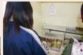
金属器の保存処理