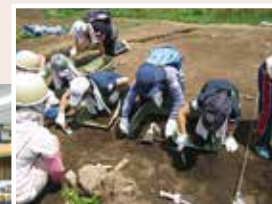
夏休みに考古学者になろう！