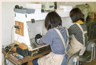
金属器の錆落とし